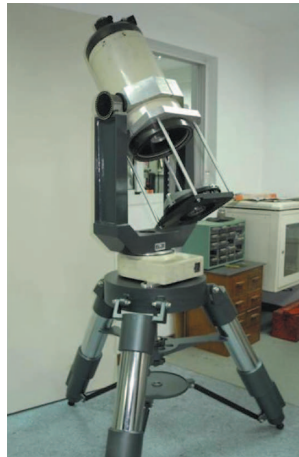
图 2 双视场大气折射望远镜原理样机的实物照片